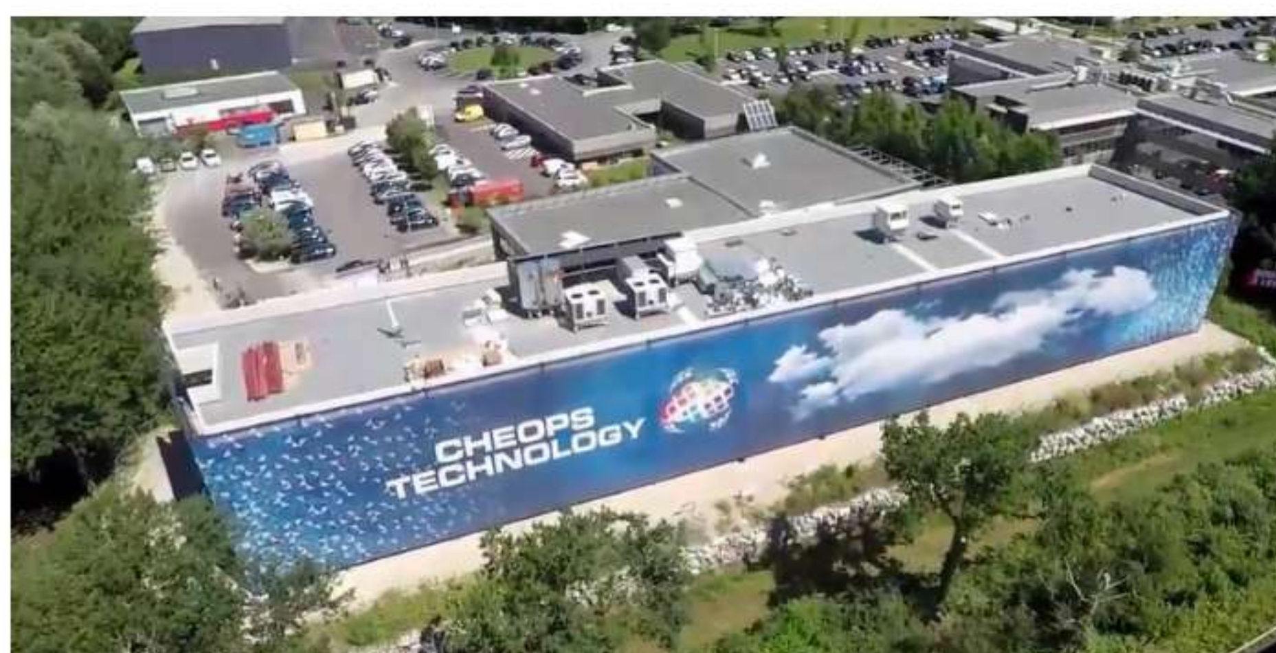
Le siège de Cheops, et son datacenter, à Canejan, près de Bordeaux

L'exercice 2020/2021 a également été marqué par la première concrétisation de l'ambition internationale de CHEOPS TECHNOLOGY avec l'acquisition en novembre 2020 de Dfi Service, acteur suisse du Cloud Computing et de la cybersécurité basé à Plan-Les-Ouates, dans la proche banlieue de Genève.